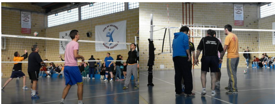
Táctica de equipo.