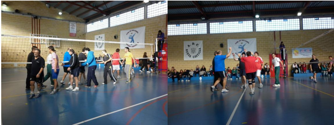
Después de las rondas previas, se juega la gran final