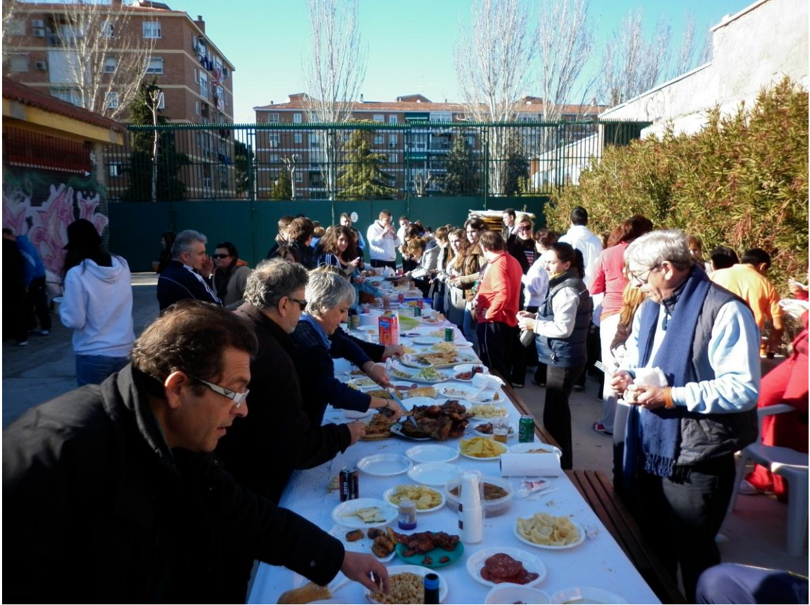
Misión cumplida: primer torneo de padres del Club Voleibol Nueva Castilla.