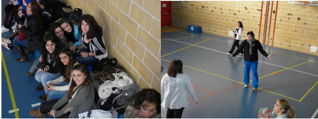
Graderío y primeras instrucciones