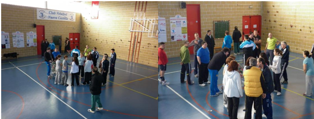
Reparto de jugadores y equipos.