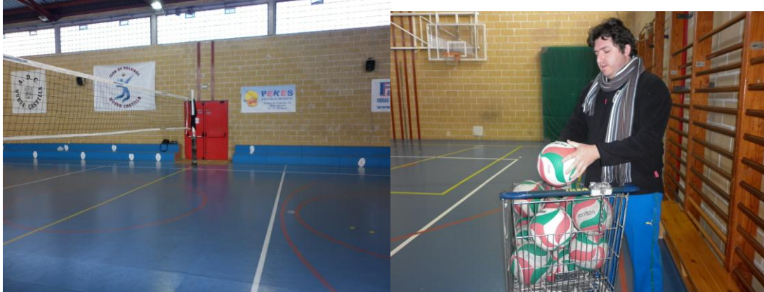
Llegada al Pabellón 11:00h.