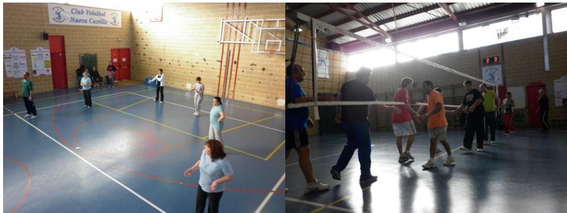
Comienzan los partidos